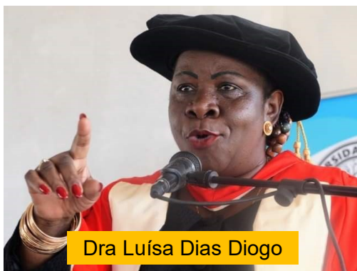
Dra Luísa Dias Diogo

Teve lugar no dia 11 de Março em Chimoio e Tete, a 1ª Cerimónia Oficial de Abertura do Ano Académico de 2020 na UniPúnguè.