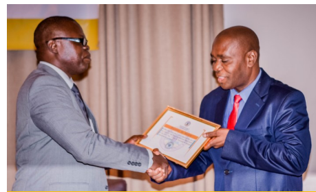
Entrega de Diploma de Honra Tete