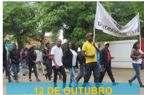
Dia do Professor