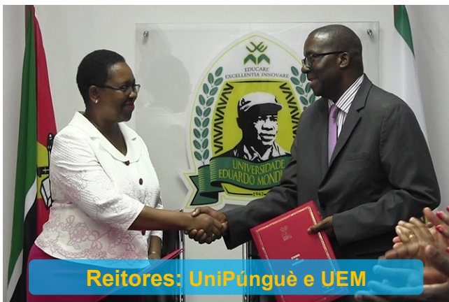
Reitores: UniPungue e UEM

As Universidades Pungue e Eduardo Mondlane passam a cooperar em matérias académica, científica, desportiva e cultural. A vontade foi expressa por meio da assinatura de um memorando de entendimento entre as duas