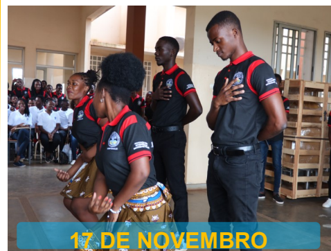
Dia Internacional do Estudante